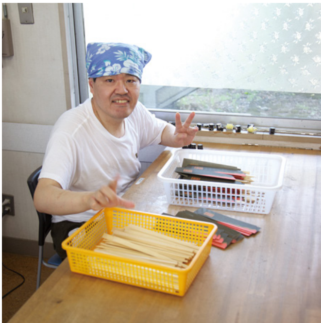
寒川町の障害のある方達が働く場所。 しっかりと仕事。でも、それだけじゃない。