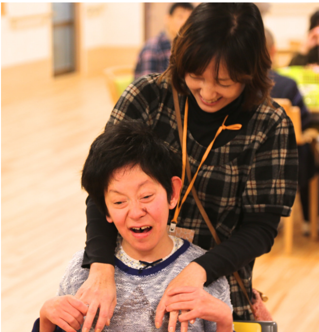
地域のみなさんの声にこたえて生まれた、 木陰のような集いの場