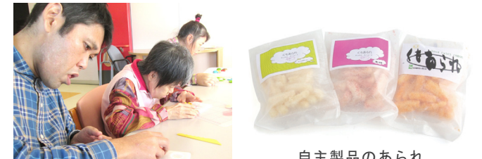
自主製品のあられ