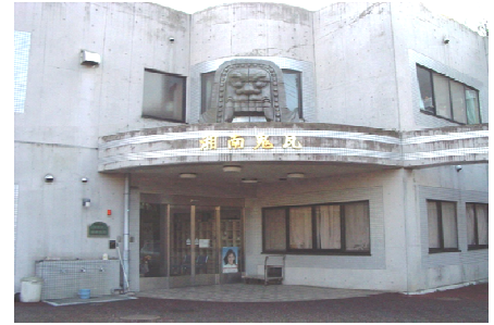
「湘南鬼瓦」 茅ヶ崎市甘沼123-2 0467-52-1005

JR茅ヶ崎駅北口 番バス乗り場より、 神奈中バス「湘南ライフタウン」行き または 「文教大学」行きに乗車。 「殿山公園前」下車 徒歩3分 * バスの乗車時間はおよそ15分です