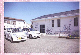
訪問看護ステーション つばさ 介護老人福祉施設 ゆるり ぷらっと東海岸