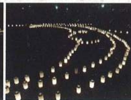
分かりにくいですが月の形