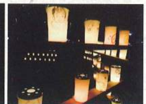
ワークショップで描いた 絵付きキャンドル

*キャンドルナイト茅ヶ崎では、キャンドルホルダーとしてご協賛いただける方を募集しています。